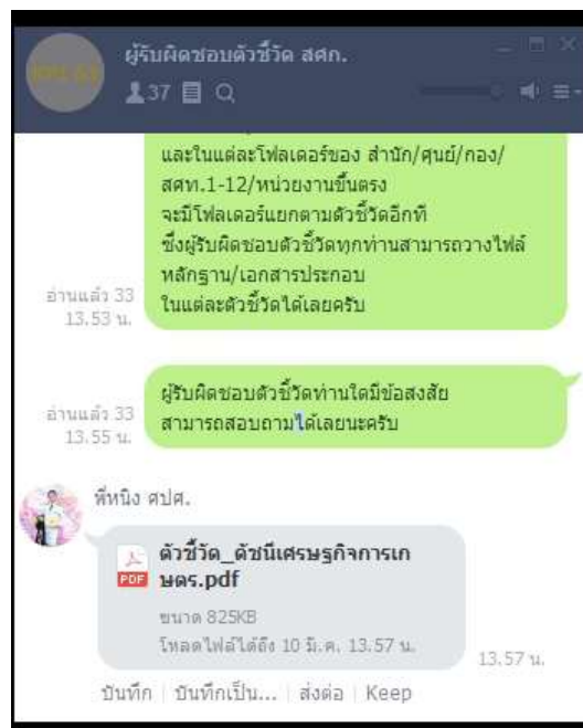
กลุ่มไลน์ “ผู้รับผิดชอบตัวชี้วัด”